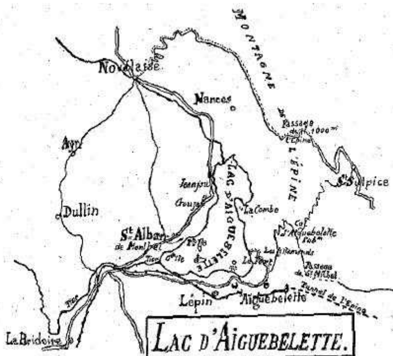
Fig. 1. — Le Lac d'Aiguebelette et ses environs.

« les masures d'une construction, qu'on dit romaine, d'environ 4 mètres de longueur sur 2 m 50 de largeur, sur lesquelles existaient encore les murs à moitié détruits, d'une autre ancienne construction ronde, qu'on appelle La Chapelle . Tout auprès et derrière les masures se trouve un sarcophage, dont la pierre supérieure, qui renferme une inscription qu'on dit romaine, a été transportée au village chef-lieu de Lépin, et sert de seuil de porte à la maison d'un nommé Cambet. Il existe aussi, près de la chapelle, une pierre qui a trois trous ronds et du grandeurs graduées 3 »